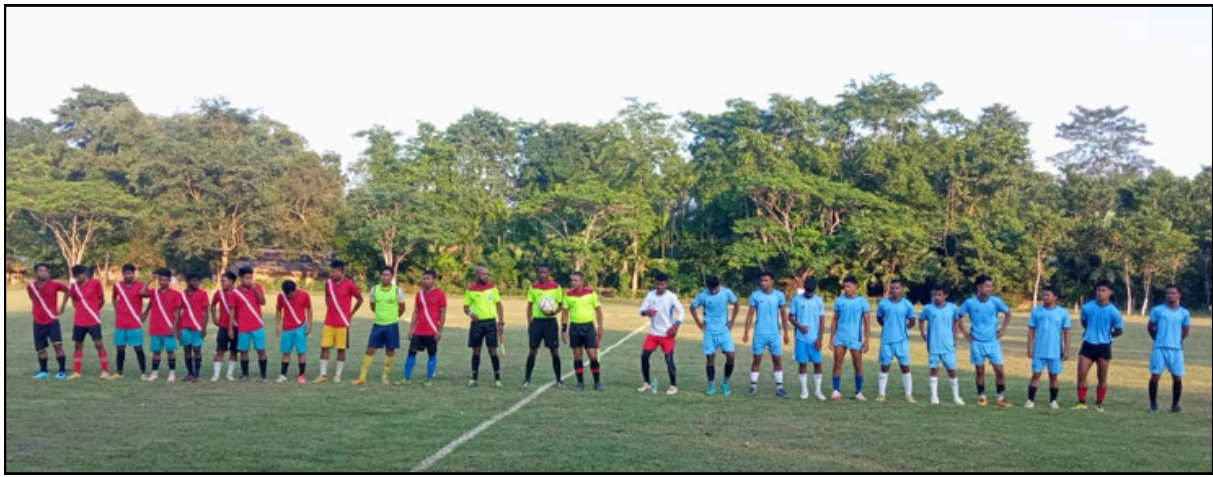
দ্বিতীয় বাৰ্ষিক 'ডিৰাক সমন্বয় কাপৰ উদ্বোধনী মেচখনৰ প্ৰাকমুহূৰ্তত দুই অংশগ্ৰহণকাৰী দল