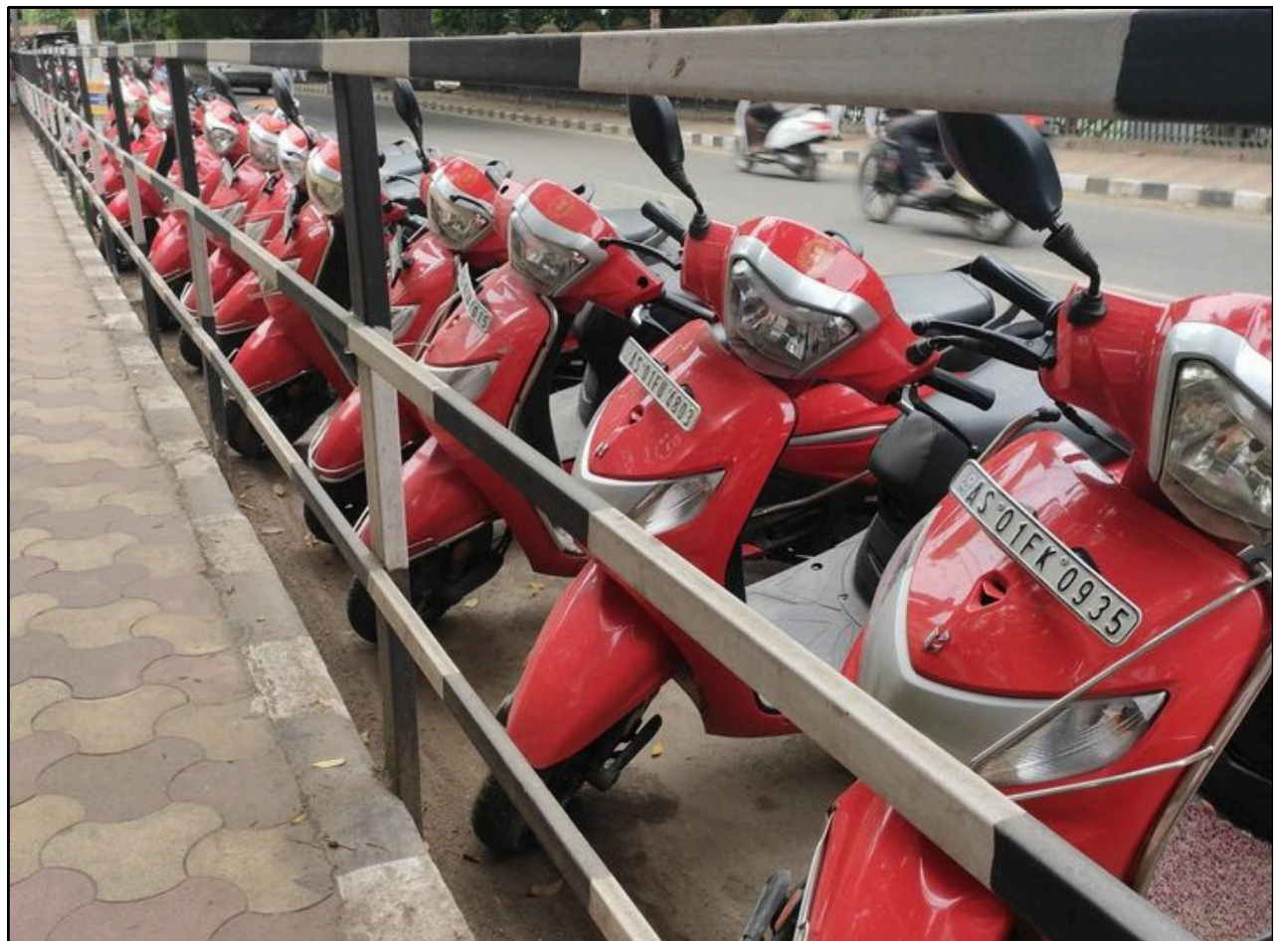
ফুলনি নহয়! সন্দিকৈ ছোৱালী মহাবিদ্যালয়ৰ সন্মুখ ভাগ ভৰিছে অসম চৰকাৰে প্ৰদান কৰা স্কুটিয়ে

অসন্তুষ্ট হৈ পৰিছে ৩০ বছৰ ধৰি অপ্ৰাদেশীকৃত শিক্ষকসকল। অসন্তুষ্ট শিক্ষকসকলে শীঘ্ৰেই তেওঁলোকৰ সমস্যা সমাধান নকৰিলে আত্মজাহ দিয়াৰ হুংকাৰ প্ৰদান কৰিছে চৰকাৰক। আনহাতে, শিক্ষা বিভাগৰ হঠকাৰী সিদ্ধান্তৰ বিৰুদ্ধে কৰ্মৰত শিক্ষকসকলৰ লগতে বিদ্যালয় পৰিচালনা সমিতি আৰু স্থানীয় ৰাইজ তীব্ৰ অসন্তুষ্ট প্ৰকাশ কৰি আজিৰে পৰা আন্দোলন কাৰ্যসূচী আৰম্ভ কৰিছে। কাৰ্যসূচীত স্থানীয় বিভিন্ন দল-সংগঠন, প্ৰাক্তন ছাত্ৰ আৰু স্থানীয় ৰাইজে অংশগ্ৰহণ কৰি শীঘ্ৰেই সমস্যা সমাধানৰ দাবী উত্থাপন কৰিছে।