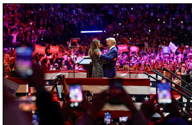
মেডিছন স্কুৱেৰ গাৰ্ডেনত ট্ৰাম্পৰ নিৰ্বাচনী প্ৰচাৰ, সোমবাৰে

ই-সংবাদ, গোলকগঞ্জ, ২৮ অক্টোবৰঃ ধুবুৰী জিলাৰ ভাৰত-বাংলাদেশ সীমান্তৰ গোলকগঞ্জ ৰোল স্টেচনত দেওবাৰে শেষাংশ ২ পৃষ্ঠাত